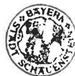
Florian Schaller Erster Bürgermeister der Stadt Schauenstein