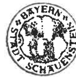
Florian Schaller Erster Bürgermeister der Stadt Schauenstein